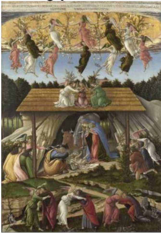
(Botticelli : Version couleur téléchargeable sur le site)